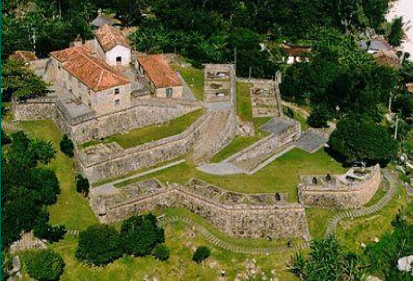
São José da Ponta Grossa