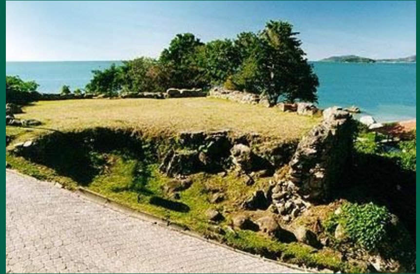
Bateria São Caetano