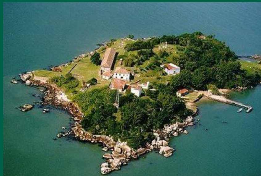
Santa Cruz de Anhatomirim