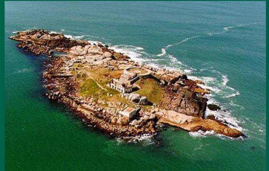
Conceição de Araçatuba